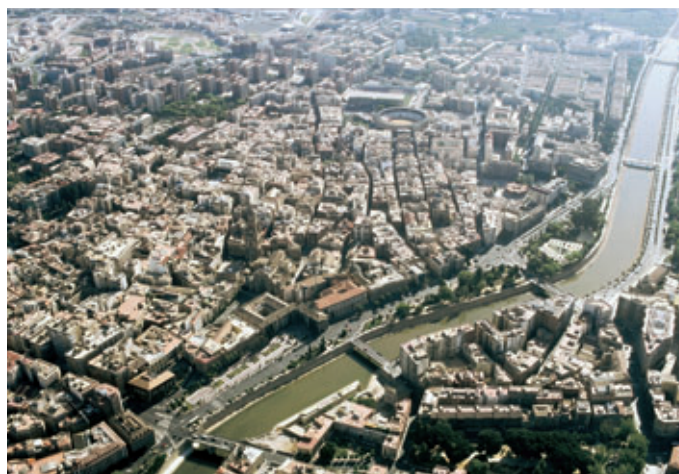
Río Segura a su paso por Murcia en la actualidad.